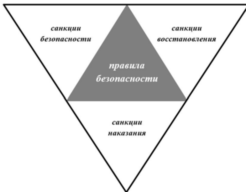
Рис. 2. Соотношение правил безопасности и санкций за их нарушение

За нарушение правил безопасности устанавливаются санкции безопасности, восстановления и наказания (см. рис. 2).